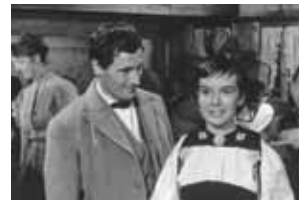
Resli & Anne Mareili